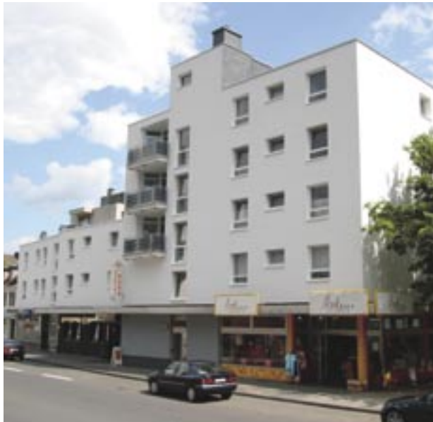
Beispiel für gute Bestandspflege: Marktstraße 15-21, Siegen-Geisweid

Auch nach fünfzig Jahren sind alle Runkel Immobilien sehr gut vermietet. Der Grund: Bereits damals legte Runkel ein besonderes Augenmerk auf preiswerten Wohnraum mit guter Wohnqualität. Die nachhaltige Bestandspflege und Modernisierung der Objekte steht auch heute im Mittelpunkt. Moderner Klimaschutz mit Wärmeverbundsystemen, gründliche Dachsanierungen, Fensteraustausch und Heizungsmodernisierungen sind nur einige Maßnahmen, mit denen Bestandsobjekte „fit“ gemacht werden.